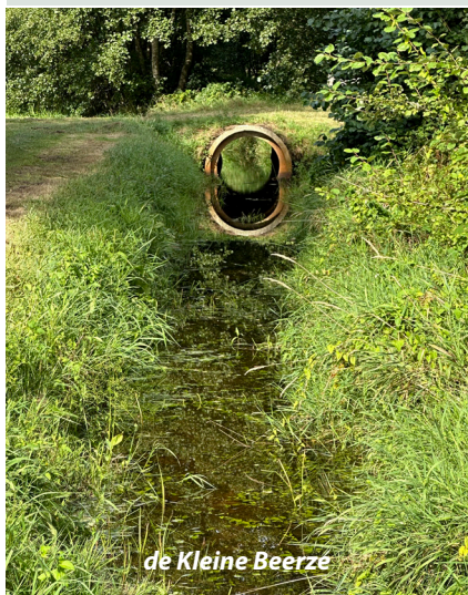
de Kleine Beerzé

In 1862 bouwde Franciscus van Hooff het café dat uitgroeide tot hét dorpscentrum. Vroeger herbergden de Donk en omgeving boerderijen, een leerlooierij en zelfs een mogelijk openbaar washuis. Het café werd het hart van het verenigingsleven, met dansavonden, muziek en tienerliefdes in de jaren '50 en '60.